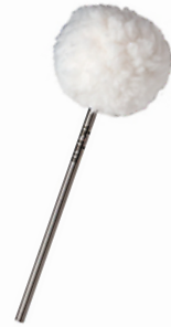
Tête laine (molle)

On peut équiper sa pédale avec différentes « battes », plus ou moins dures, on choisira en fonction du son que l'on souhaite avoir ou du style à jouer.