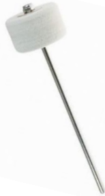
Tête feutre (standard)