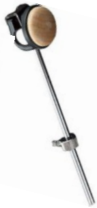
Tête bois (dur)