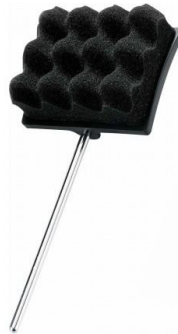
Tête mousse (molle)